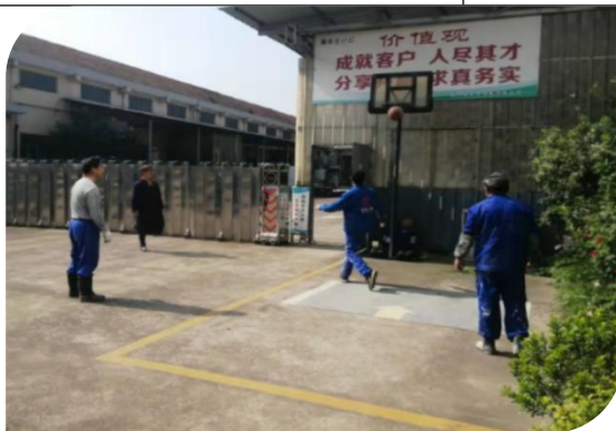
公司第五届运动会